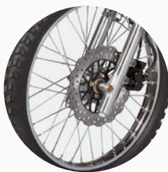
Freno delantero de disco.