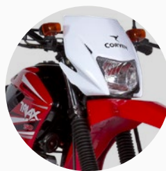
Horquilla hidráulica invertida.