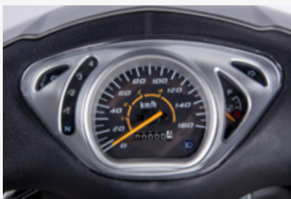
TALBERO CON INDICADOR DE COMBUSTIBLE