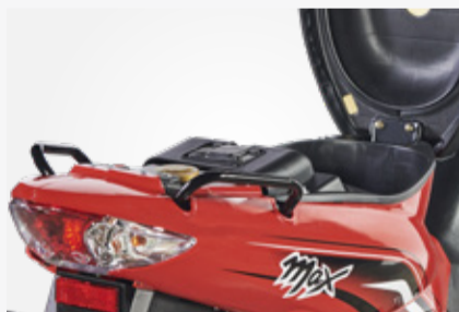
AMPLIO BAUL BAJO ASIENTO